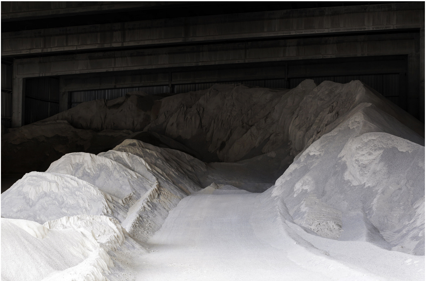
© Emma Grosbois, Vaisseau Fantôme , 2023