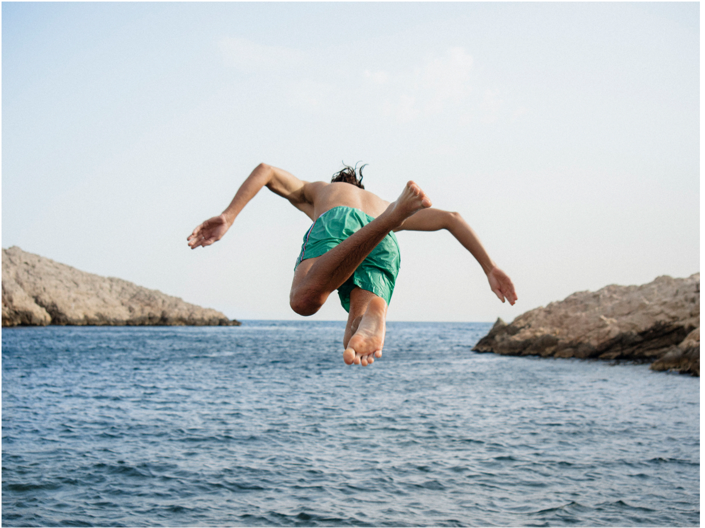
© Julia Gat, Port de Callelongue , 2023