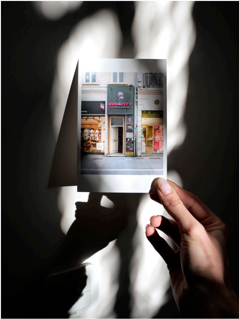
© Amélie Blanc, Sun City , 2023