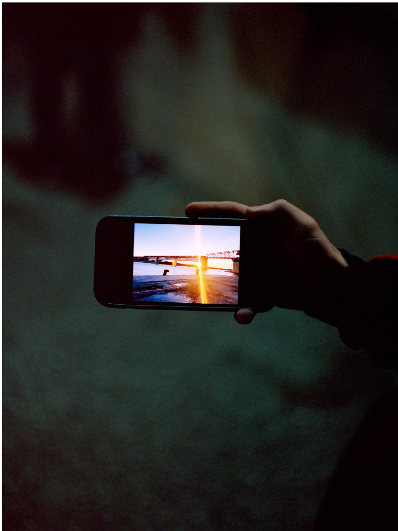
© Simon Bouillère, Le Pont de Caronte