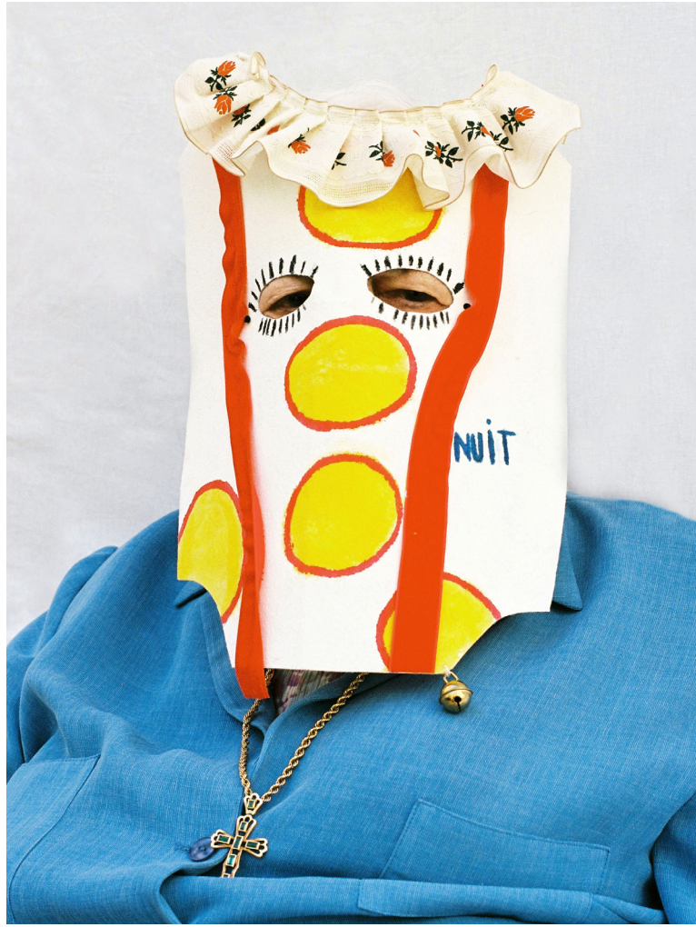
© Emma Tholot, Le sommeil de l'ours , Charlotte, 2023