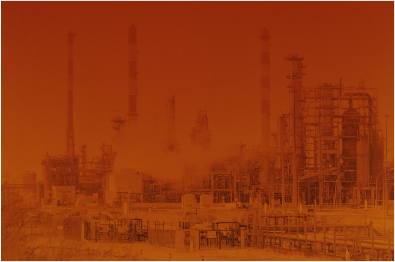
© Pierre Girardin, Rafinerie , 2024